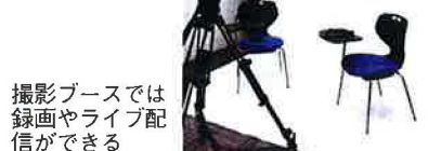
ではライブ配信や録画ができる