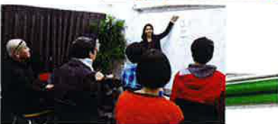
英語の模擬レッスンが実施された