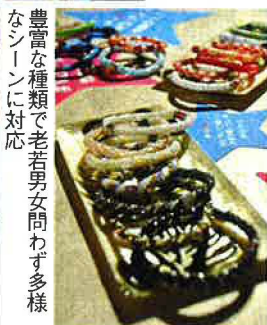
豊富な種類で老若男女問わず多様なシーンに対応